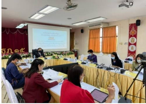
ภาพที่ ๕ แสดงการประชุมวิพากษ์ (ร่าง) คู่มือหลักสูตรด้านทฤษฎีศึกษาภาคเหนือ พ.ศ. ๒๕๖๕ สำหรับสถานศึกษาในสังกัด สช.

สังกัดสำนักงานคณะกรรมการส่งเสริมการศึกษาเอกชน และ (ร่าง) คู่มือหลักสูตรด้านทฤษฎีศึกษาภาคเหนือ พ.ศ. ๒๕๖๕ สำหรับสถานศึกษาสังกัดสำนักงานส่งเสริมการศึกษานอกระบบและการศึกษาตามอัธยาศัย ไปปรับปรุงเพื่อให้คู่มือมีความสมบูรณ์ก่อนนำไปใช้