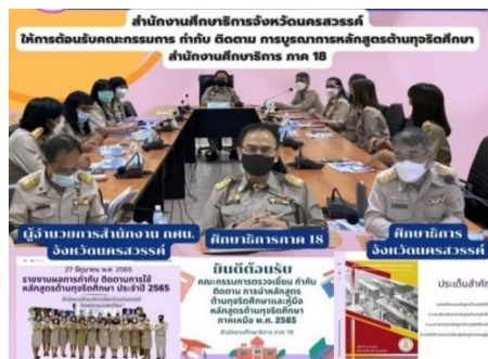
ภาพที่ ๑๔ แสดงการลงพื้นที่ตรวจเยี่ยม กำกับ ติดตาม การนำหลักสูตรด้านทฤษฎีศึกษาไปบูรณาการในการจัดการเรียนการสอนในพื้นที่ ศธภ. ๑๘