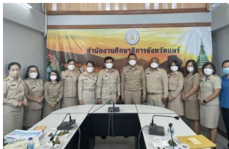
ภาพที่ ๑๒ แสดงการลงพื้นที่ตรวจเยี่ยม กำกับ ติดตาม การนำหลักสูตรด้านทฤษฎีศึกษาไปบูรณาการในการจัดการเรียนการสอนในพื้นที่ ศธภ. ๑๖