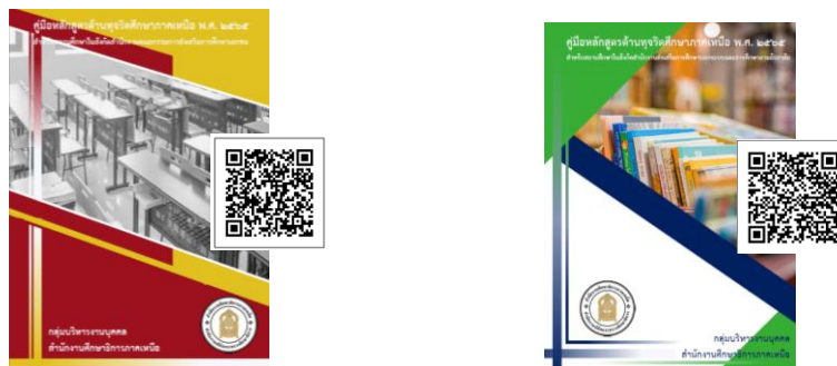
ภาพที่ ๗ แสดงคู่มือหลักสูตรด้านทฤษฎีศึกษาศึกษาภาคเหนือ พ.ศ. ๒๕๖๕

๒.๔.๑ จัดทำคู่มือหลักสูตรด้านทฤษฎีศึกษาศึกษาภาคเหนือ พ.ศ. ๒๕๖๕ สำหรับสถานศึกษา ในสังกัดสำนักงานคณะกรรมการส่งเสริมการศึกษาเอกชน จำนวน ๑๔๐ เล่ม สำหรับสถานศึกษาในสังกัด สำนักงาน ส่งเสริมการศึกษานอกระบบและการศึกษาตามอัธยาศัยจังหวัด จำนวน ๑๔๐ เล่ม