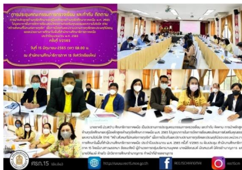
ภาพที่ ๑๐ แสดงการประชุมชี้แจงวัตถุประสงค์การตรวจเยี่ยม กำกับ ติดตาม และวางแผนการกำกับ ติดตาม การนำหลักสูตรด้านทฤษฎีศึกษาไปบูรณาการในการจัดการเรียนการสอน

๒. สำนักงานศึกษาธิการภาคเหนือ จัดส่งประกาศแต่งตั้งคณะกรรมการตรวจเยี่ยม กำกับ ติดตาม การนำหลักสูตรด้านทฤษฎีศึกษา และคู่มือหลักสูตรด้านทฤษฎีศึกษาภาคเหนือ พ.ศ. ๒๕๖๕ ไปบูรณาการในการจัดการเรียนการสอนโครงการส่งเสริมคุณธรรมและความโปร่งใส (ITA) “สร้างสังคมที่ไม่ทนต่อการทุจริต” เพื่อการป้องกันและปราบปรามการทุจริตและประพฤติมิชอบของหน่วยงานการศึกษาในพื้นที่สำนักงานศึกษาธิการภาคเหนือ ประจำปีงบประมาณ พ.ศ. ๒๕๖๕ แบบกำกับ ติดตาม การนำหลักสูตรไปบูรณาการในการจัดการเรียนการสอน และแบบเก็บข้อมูลตัวชี้วัดที่ ๑ – ๓ ไปยังสำนักงานศึกษาธิการภาค ๑๕ - ๑๘ และขอให้แจ้งสำนักงานศึกษาธิการจังหวัด สำนักงานส่งเสริมการศึกษานอกระบบและการศึกษาตามอัธยาศัยจังหวัดในพื้นที่ทราบ และมอบหมายให้สำนักงานศึกษาธิการจังหวัดทำหน้าที่ประสานงานกับคณะกรรมการกำกับ ติดตาม ระดับจังหวัด ทั้งนี้ ขอให้คณะกรรมการระดับภาค คณะกรรมการระดับจังหวัด และหน่วยงานกำกับ ติดตามในพื้นที่ดำเนินการตรวจเยี่ยม กำกับ ติดตาม ระหว่างวันที่ ๑๖ – ๓๐ มิถุนายน ๒๕๖๕ โดยใช้แบบฟอร์มกำกับ ติดตาม พร้อมทั้งสรุปและจัดส่งหน่วยงานที่เกี่ยวข้องภายในระยะเวลาที่กำหนด