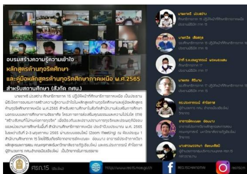
ภาพที่ ๙ แสดงการอบรมสร้างความรู้ความเข้าใจในหลักสูตรด้านทฤษฎีศึกษา และคู่มือหลักสูตรด้านทฤษฎีศึกษาภาคเหนือ พ.ศ. ๒๕๖๕ สำหรับสถานศึกษาในสังกัด กศน.

๑.๒ จัดส่งคู่มือหลักสูตรด้านทฤษฎีศึกษา พ.ศ. ๒๕๖๕ ให้แก่หน่วยงานการศึกษาใช้เป็นแนวทางการปฏิบัติงาน ดังนี้