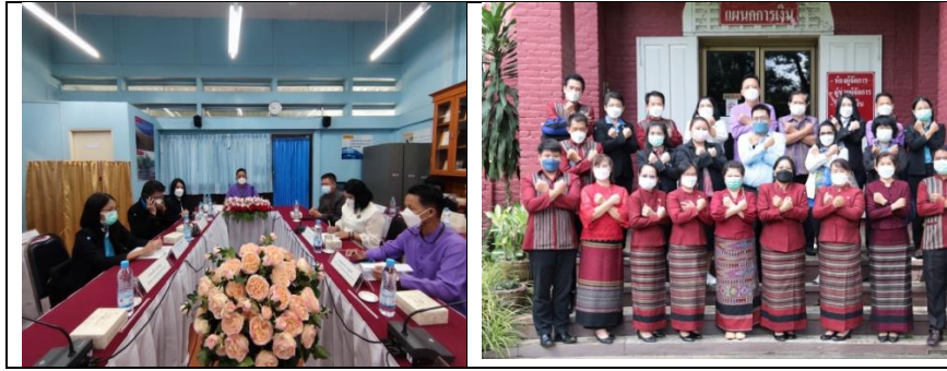
ภาพที่ ๑๙ แสดงการตรวจเยี่ยม กำกับ ติดตาม การนำหลักสูตรด้านทฤษฎีศึกษาไปบูรณาการในการจัดการเรียนการสอน โรงเรียนน่านคริสเตียนศึกษา อำเภอเมือง จังหวัดน่าน