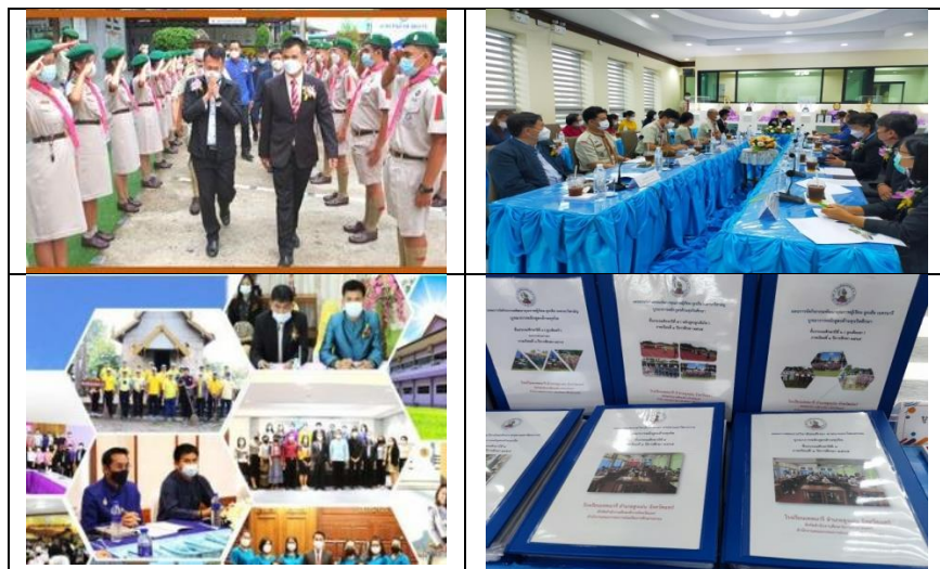
ภาพที่ ๑๘ แสดงการตรวจเยี่ยม กำกับ ติดตาม การนำหลักสูตรต้านทุจริตศึกษาไปบูรณาการในการจัดการเรียนการสอน โรงเรียนเทพนารี อำเภอสูงเม่น จังหวัดแพร่