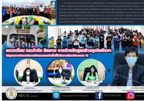
ภาพที่ ๑๑ แสดงการลงพื้นที่ตรวจเยี่ยม กำกับ ติดตาม การนำหลักสูตรด้านทฤษฎีศึกษาไปบูรณาการในการจัดการเรียนการสอนในพื้นที่ ศธภ. ๑๕