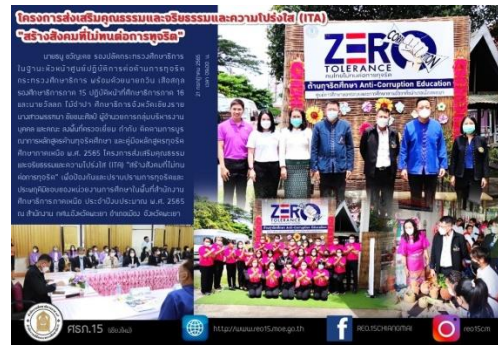
ภาพที่ ๑๗ แสดงการตรวจเยี่ยม กำกับ ติดตาม การนำหลักสูตรต้านทุจริตศึกษาไปบูรณาการในการจัดการเรียนการสอน กศน.อำเภอเมืองพะเยา จังหวัดพะเยา