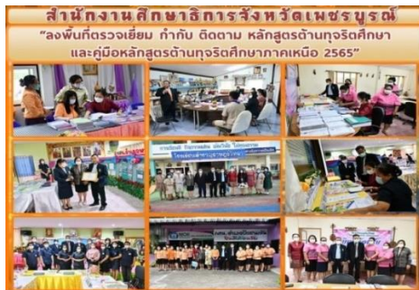
ภาพที่ ๑๓ แสดงการลงพื้นที่ตรวจเยี่ยม กำกับ ติดตาม การนำหลักสูตรด้านทฤษฎีศึกษาไปบูรณาการในการจัดการเรียนการสอนในพื้นที่ ศธภ. ๑๗