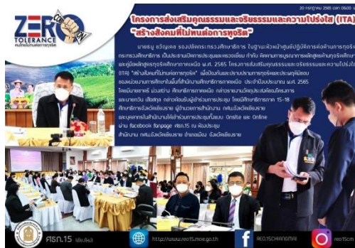
ภาพที่ ๑๕ แสดงการประชุมรายงานความก้าวหน้าโครงการ และการตรวจเยี่ยม กำกับ ติดตาม การนำหลักสูตรด้านทุจริตศึกษาไปบูรณาการในการจัดการเรียนการสอนในพื้นที่สำนักงานศึกษาธิการภาคเหนือ ณ ห้องประชุม สำนักงาน กศน.จังหวัดเชียงราย

ความก้าวหน้าในการดำเนินงานโครงการ และเอกสารประกอบ โดย ศึกษาธิการภาค และผู้แทนของสำนักงาน ศึกษาธิการภาคแต่ละแห่งนำเสนอ ผลการดำเนินงานโครงการในพื้นที่สำนักงานศึกษาธิการภาคเหนือ ผลการตรวจ เยี่ยม กำกับ ติดตามการดำเนินงานในพื้นที่สำนักงานศึกษาธิการภาค ๑๕ สำนักงานศึกษาธิการภาค ๑๖ สำนักงาน ศึกษาธิการภาค ๑๗ สำนักงานศึกษาธิการภาค ๑๘ ผู้เข้าร่วมประชุม ประกอบด้วย ผู้ช่วยเลขาธิการคณะกรรมการ ป.ป.ช. ภาค ๕ ศึกษาธิการภาค ๑๕ ศึกษาธิการภาค ๑๖ ศึกษาธิการภาค ๑๗ ศึกษาธิการภาค ๑๘ ศึกษาธิการภาค ๘ และ ๔ ผู้อำนวยการสำนักงาน ป.ป.ช. ประจำจังหวัดเชียงราย ศึกษาธิการจังหวัดเชียงราย ศึกษาธิการจังหวัด พระนครศรีอยุธยา ผู้อำนวยการสำนักงานส่งเสริมการศึกษานอกระบบและการศึกษาตามอัธยาศัยจังหวัดเชียงราย ผู้อำนวยการ สวท.เชียงราย ประธานกรรมการประสานและส่งเสริมการศึกษาเอกชนจังหวัดเชียงราย และคณะ ผู้บริหารสถานศึกษา ครู คณะทำงาน และผู้ที่มีส่วนเกี่ยวข้อง ในรูปแบบ Onsite รวมจำนวน ๗๕ คน และเชิญ ศึกษาธิการจังหวัด ผู้อำนวยการสำนักงานส่งเสริมการศึกษานอกระบบและการศึกษาตามอัธยาศัยจังหวัด และ บุคลากรในสังกัดที่ไม่ได้เข้าร่วมประชุมแบบ Onsite เข้าร่วมประชุม Online ผ่าน facebook panpage สำนักงาน ศึกษาธิการภาค ๑๕