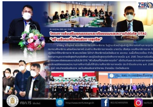
ภาพที่ ๑๖ แสดงการตรวจเยี่ยม กำกับ ติดตาม การนำหลักสูตรต้านทุจริตศึกษาไปบูรณาการในการจัดการเรียนการสอน กศน.อำเภอเมืองเชียงราย และโรงเรียนเชียงรายวิทยาคม อำเภอเมือง จังหวัดเชียงราย

โรงเรียนน่านคริสเตียนศึกษา อำเภอเมือง จังหวัดน่าน นำเสนอผลการดำเนินงานและให้ข้อมูลในการขับเคลื่อน การนำหลักสูตรต้านทุจริตศึกษาไปบูรณาการในการจัดการเรียนการสอน และให้การต้อนรับอย่างดียิ่ง