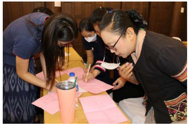
กิจกรรมที่ ๒ การประชุมเชิงปฏิบัติการเพื่อเพิ่มความรู้และทักษะในการพัฒนาบุคลากร สำนักงานศึกษาธิการจังหวัดเชียงราย ณ โรงแรมโดมอนด์ปาร์คอินน์ เชียงราย รีสอร์ท