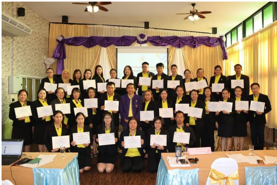
บุคลากรของสำนักงานศึกษาธิการจังหวัดเชียงราย รับมอบเกียรติบัตรผ่านการอบรมเชิงปฏิบัติการ เพื่อเสริมสร้างศักยภาพบุคลากรของสำนักงานศึกษาธิการจังหวัดเชียงราย