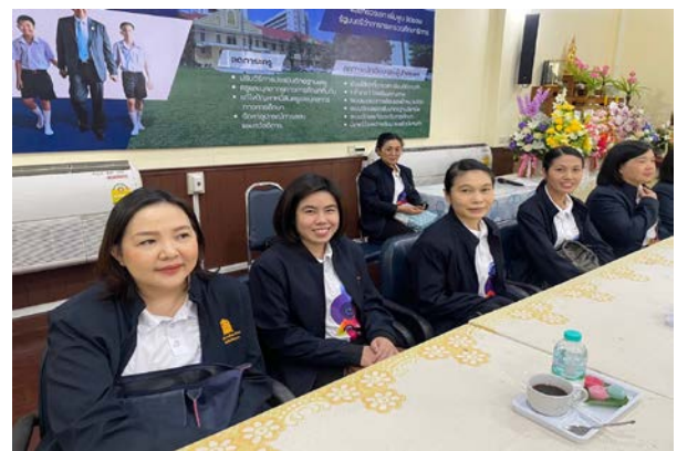
กิจกรรมที่ ๓ การพัฒนาศักยภาพบุคลากรผ่านกิจกรรมการเรียนรู้จากประสบการณ์จริง ด้านการส่งเสริมคุณธรรม จริยธรรม ธรรมภิบาล ในการปฏิบัติราชการ ณ สำนักงานศึกษาธิการภาค ๑๗ ตำบลหัวรอ อำเภอเมือง จังหวัดพิษณุโลก