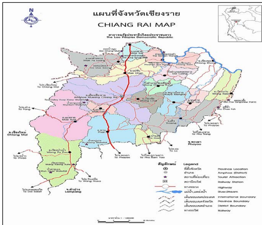
ภาพที่ 1 แสดงแผนที่จังหวัดเชียงราย

จังหวัดเชียงราย มีชายแดนติดกับประเทศเมียนมาร์ยาวประมาณ 130 กิโลเมตรและมีชายแดนติดต่อกับ ไชย สาธารณรัฐประชาธิปไตยประชาชนลาว ประมาณ 180 กิโลเมตร ตามแผนที่จังหวัดเชียงราย